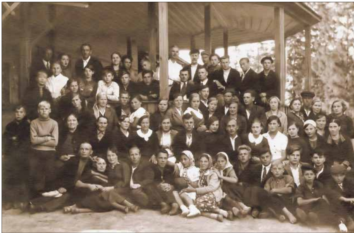
Комсомольцы Завода имени Морозова. 30-е годы