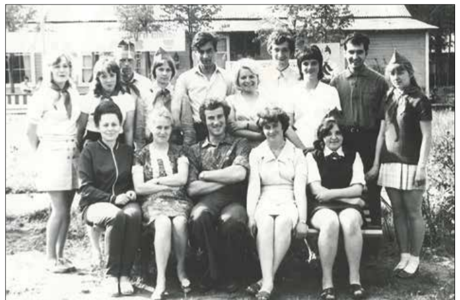
Комсомольцы-вожатые. Пионерский лагерь «Ветерок»