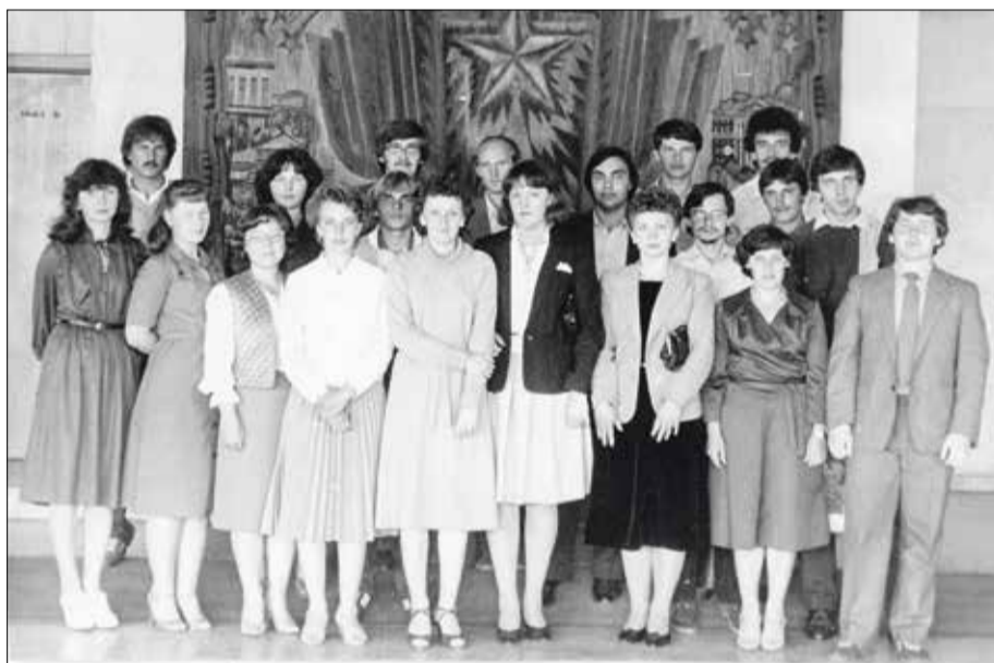
Участники XIII Слета молодых передовиков производства. 1984 год