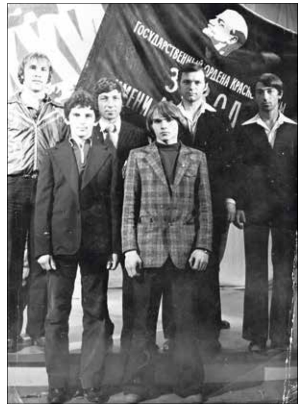
Комсомольцы цеха № 9